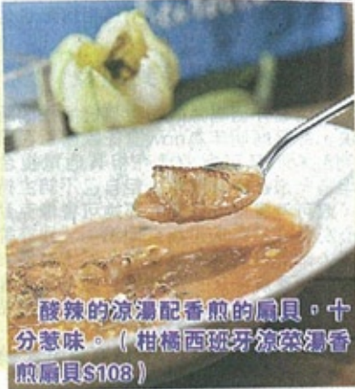
酸辣的涼湯配香煎的扇貝，十分惹味。(柑橘西班牙涼菜湯香煎扇貝$108)