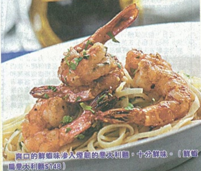
爽口的鮮蝦味滲入煙韌的意大利麵，十分鮮味。(鮮蝦扁意大利麵$148)