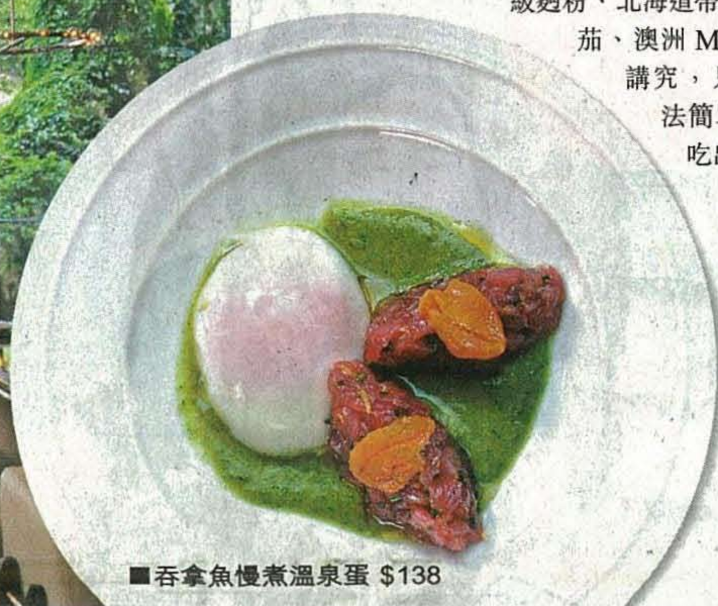
■吞拿魚慢煮溫泉蛋 $138

單看頭盤，就有很多驚喜，墨汁意式忌廉薯茸利用小龍蝦湯和日本墨汁粉煮成醬，薯茸和加入 rosemary 的橄欖油混合後，用氣槍加上墨醬上，薯茸滑得像 cappuccino 般幼細。慢煮了 26 小時的和牛臉頰，再放上烘脆了的 Brioche 多士，一脛一脆極具口感。而吞拿魚慢煮溫泉蛋就很有 The Drawing Room 的影子，意大利蛋用 62°C 煮 20 分鐘變成溫泉蛋，配上海膽和拖羅更惹味。翻開主菜餐牌，只得自家製的意粉，貫徹 Tony 愛意粉又要簡約的作風，用上意大利蛋和 00 麵粉製，顏色更鮮黃。意式雲吞餡料以鴨為主，「用鴨骨熬濃的鴨醬，內包鴨肉和 Burrata 芝士，本身就有北京填鴨般濃厚味道，再批上新鮮橙絲，又可中和油膩。」幼身天使麵則加入用小龍蝦湯和海膽拌勻，每啖都吃到海膽的鮮味。