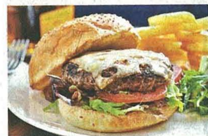
■經典 Staunton's 漢堡，六安士澳洲牛加濃味的瑞士芝士，再加惹味，$128。