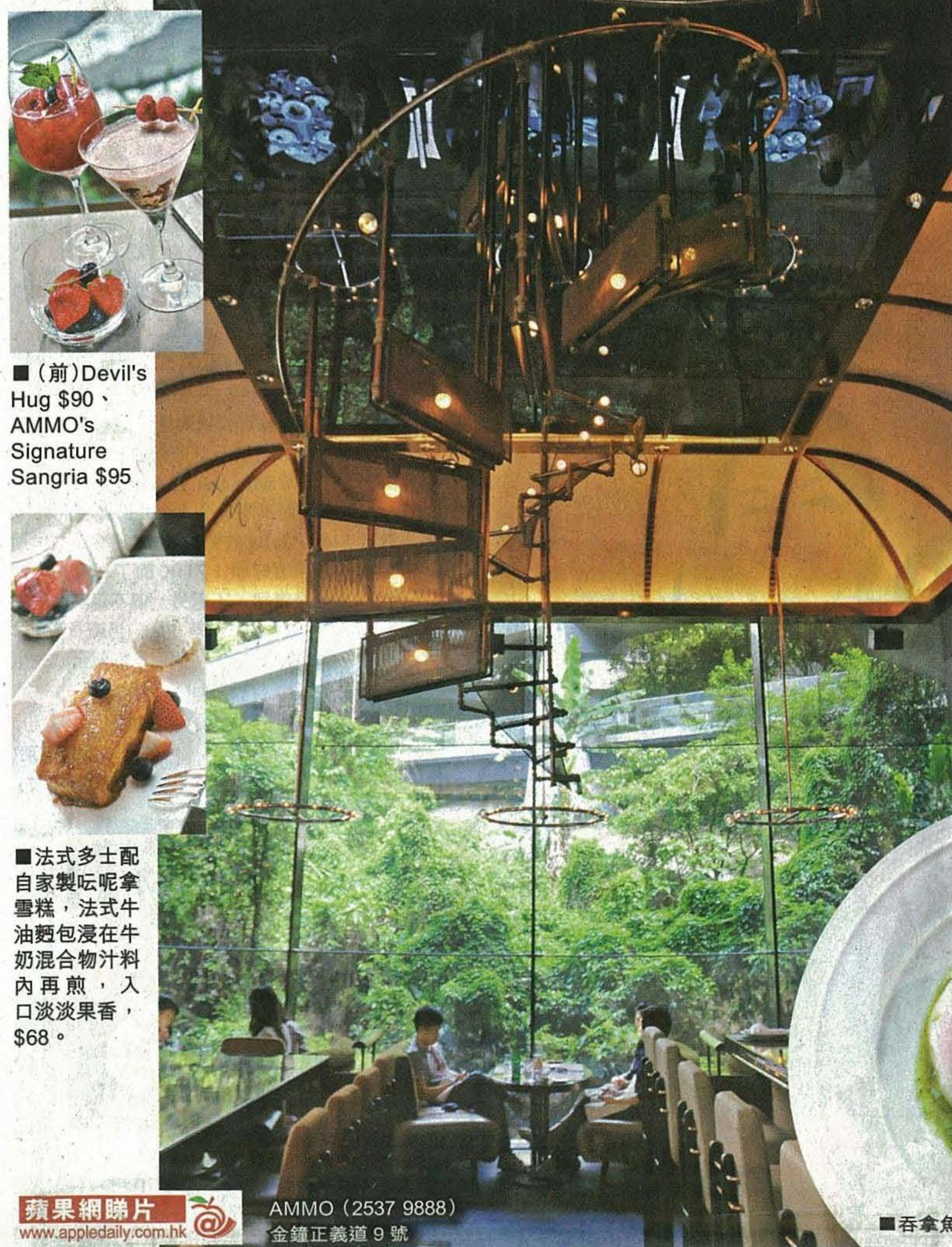
■(前) Devil's Hug $90、AMMO's Signature Sangria $95