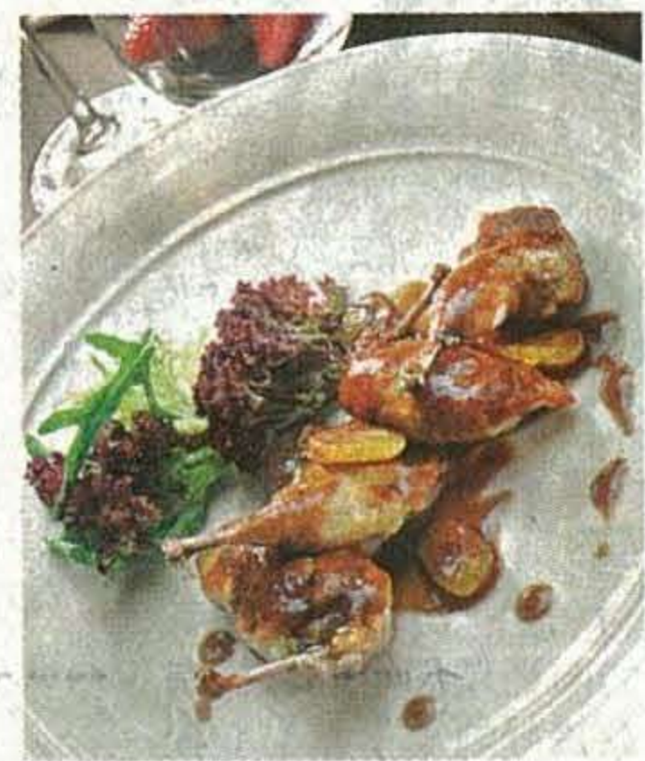
■鴨鵝煙肉葡萄沙律 $128