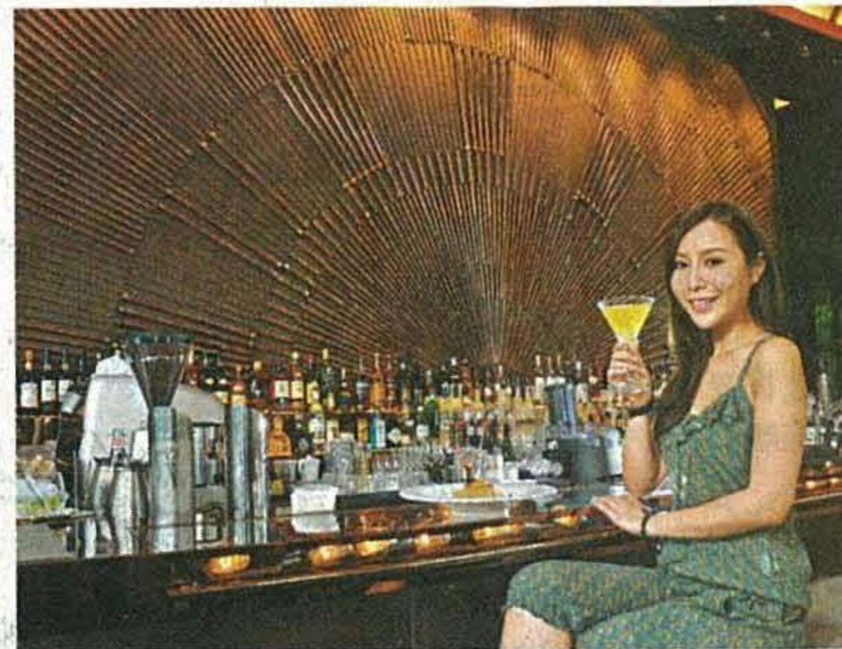
■吧枱背後以粗幼鋼管砌牆身，感覺很粗獷。