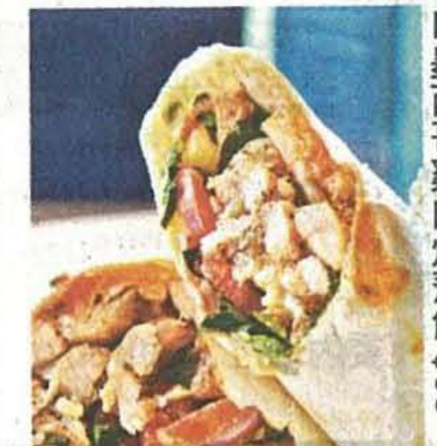
■墨西哥雞肉烤薄餅 $98

Staunton's Wine Bar & Cafe (2973 6611) 中環蘇豪士丹頓街 10-12 號