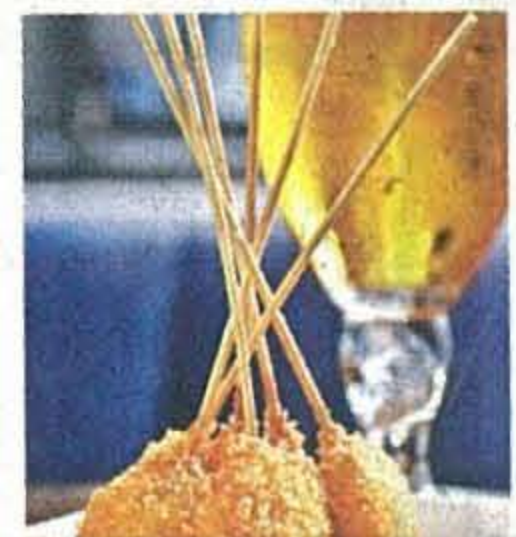
■香炸西班牙辣肉腸 $48